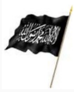
Hizb ut Tahrir

Siyaset, ümmetin işlerini dâhilen ve haricen gütmektir. Bu da devlet ve ümmet tarafından olur. Zira pratik olarak bu gütmeyi üstlenen bizzat devlettir ve bundan dolayı devleti muhasebe edecek olan da bizzat ümmettir.