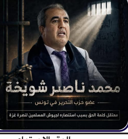
عضو حزب التحرير في تونس معتقل كلمة الحق بسبب استنصاره ليهود المسلمين للضرة غرة

المقر الاجتماعي 17، نهج باب الخضراء تونس